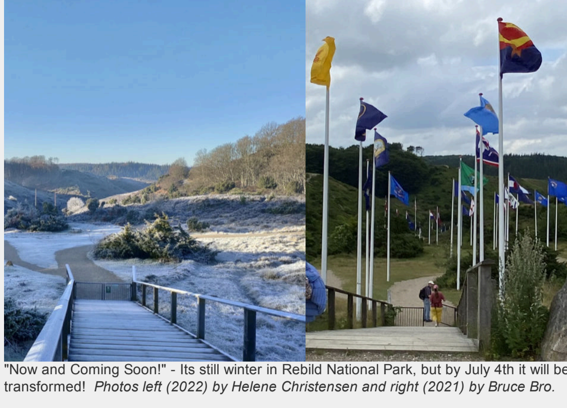
"Now and Coming Soon!" - Its still winter in Rebild National Park, but by July 4th it will be transformed!